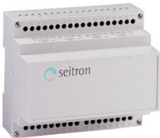
Рис. 1 Внешний вид